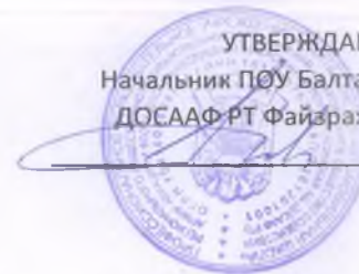
График пользования закрытой площадкой (автодром)